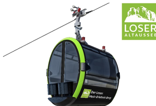
Abb. 1: Ansicht geplante Kabinenbahn Loser Bergbahnen (Copyright Bartholet Maschinenbau AG)

Alpine Mobilität für die nächste Generation.