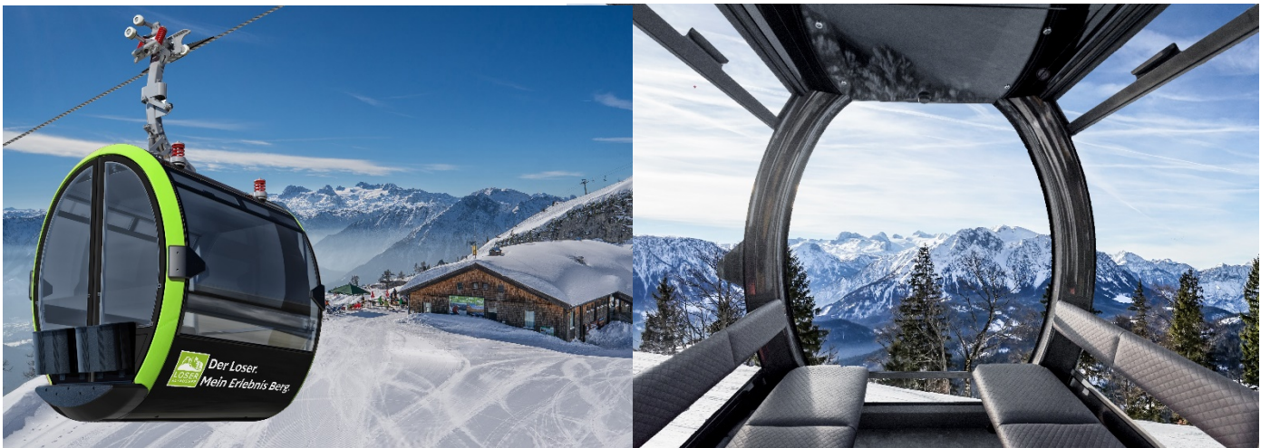
Abb.3: Kabinenbahn im Winter. Außen- und Innenansicht. (Bartholet Maschinenbau AG, Fotomontage Loser Bergbahnen)