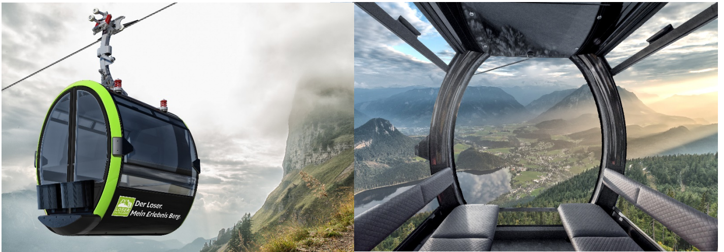
Abb.2: Kabinenbahn im Sommer. Außen- und Innenansicht. (Bartholet Maschinenbau AG, Fotomontage Loser Bergbahnen)